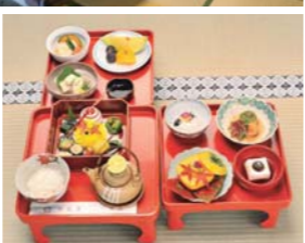
高野山定番のごま豆腐、丁寧に作った出汁で煮含めた山菜など、舌も目も楽しめる精進料理が人気の一乗院

迎えました。この危機を、各寺院は宿泊施設を提供する「宿坊」へと転換することで乗り越えたのでした。